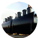
Емкости и силосы