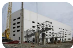
Цех по производству окатышей в г. Хромтау