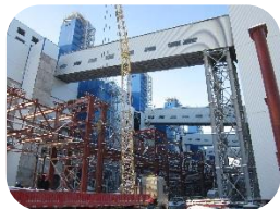
Четвертый плавильный цех АО «ТНК «Казхром»