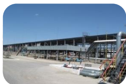
Нефтеналивная эстакада «ТШО» в г. Атырау